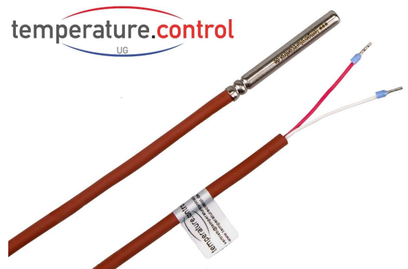
Abbildung mit Silikon-Leitung